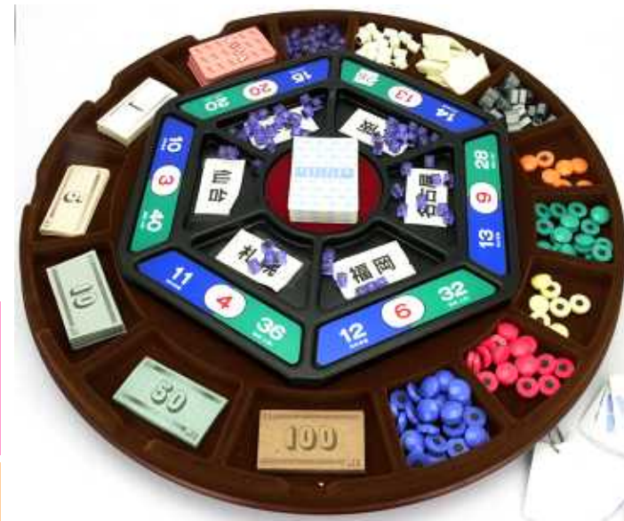
MGツール: マーケット盤 / 経営資源チップ