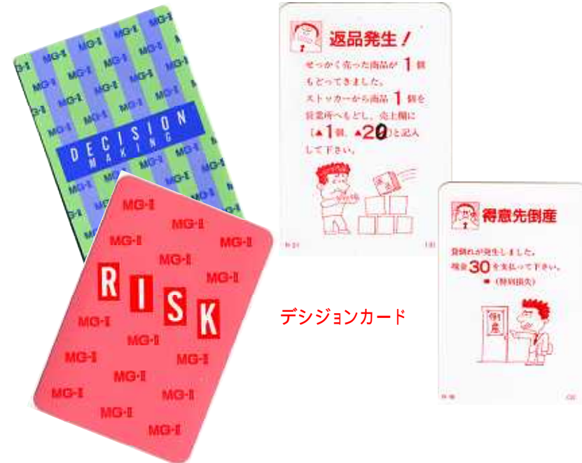
デジジョンカード